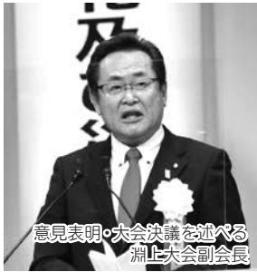
意見表明・大会決議を述べる 淵上副会長