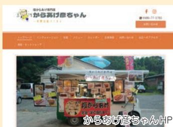
からあげ彦ちゃんHP