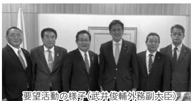
要望活動の様子(武井俊輔外務副大臣)