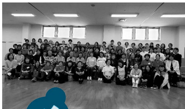
表彰式後、参加者全員で