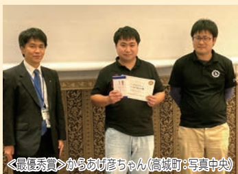
＜最優秀賞＞からあげ彦ちゃん(高城町:写真中央)