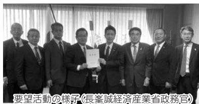
要望活動の様子(長峯誠経済産業省政務官)