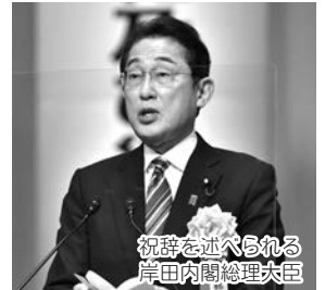
祝辞を述べられる 岸田内閣総理大臣