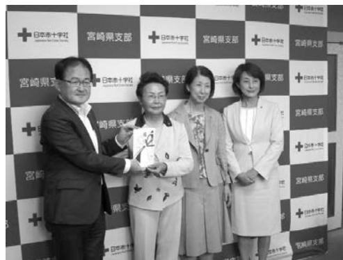
日本赤十字社宮崎県支部での目録贈呈式