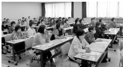
女性部が活躍するイベントや研修会の様子