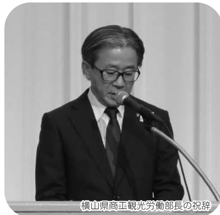
横山県商工観光労働部長の祝辞