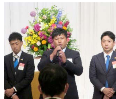
挨拶を述べる新役員