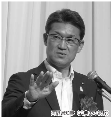
河野県知事（式典での祝辞）