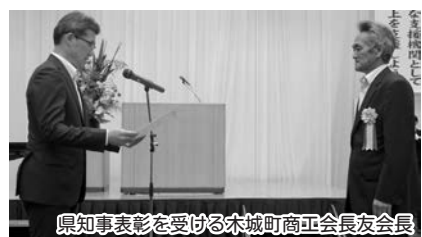
県知事表彰を受ける木城町商工会長友会長