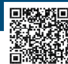
助成金ガイドブック