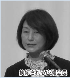
挨拶される広瀬会長

総会終了後、ランチ交流会を初めて開催し、参加した女性部長同士が親睦を深めました。