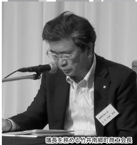
議長を務める竹井南郷町商工会長