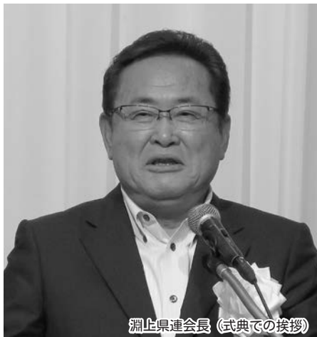
淵上県連会長（式典での挨拶）