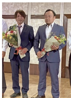
写真撮影に応じる卒部生