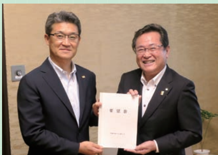
河野知事へ要望書手交の様子