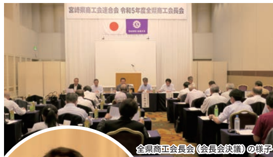
全県商工会長会(会長会決議)の様子