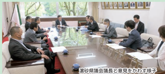
瀬上県議会議長と意見をかわす様子