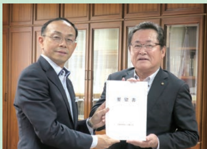
池田市長会長へ要望書手交の様子